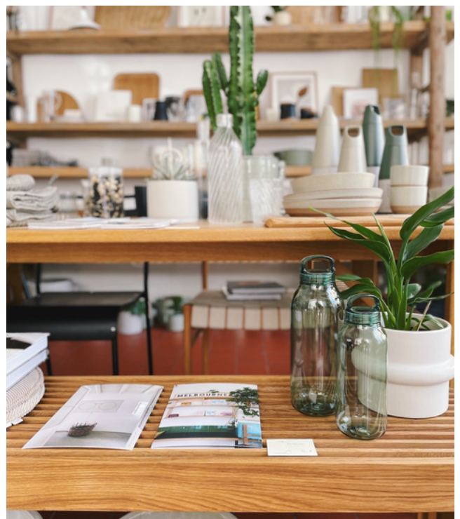
Gute Dinge für ein gutes Leben.

Ganz ehrlich - mehr Zeit für meine persönliche Kreativität und auch Arbeit wird wieder kommen. Mehr als genügend. Das Heute ist zu schön, um es nicht so zu lieben, wie es eben ist.