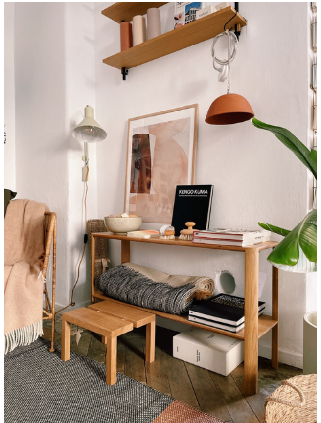
Zur Ruhe kommen beim Shoppen - im REIBOLDS.

3. Schließt sich direkt an: Mit manchen „Hüten“ komme ich bestens klar, andere sind eher herausfordernd und prallen auf Schwächen, bzw. Dinge, die mir einfach nicht liegen oder mich viel kosten. Daran zu wachsen, mich zu entwickeln und mir da Hilfe zu holen, wo ich an Grenzen komme.